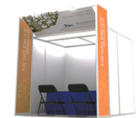
* 전시 상담부스 안